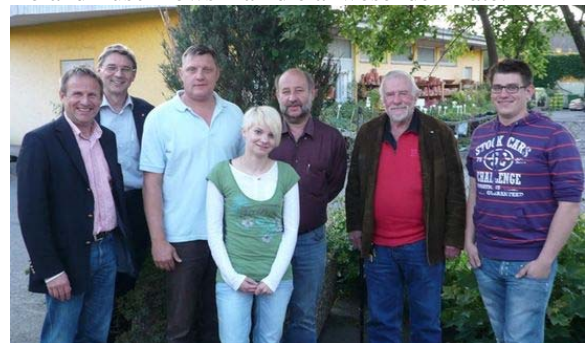
Der neu gewählte AfA- Vorstand mit Unterstützern Auf dem Bild zu sehen: