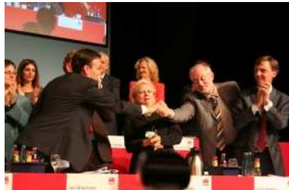
Glückwünsche für Nils Schmid