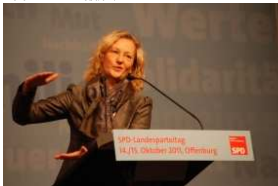
„GWL“ am Rednerpult

Spannend war die Debatte um zwei Antragspakete: Familienpolitik und Parteireform. Ob der Besuch der Kinder in der KITA künftig gebührenfrei sein soll, dieses Thema führte ebenso wie das Rederecht von jedem Parteimitglied beim Parteitag zu heftigen Kontroversen mit dem Votum der Antragskommission, die stets für maßvolle Haltungen und Vernunft eintrat und damit die Geduld mancher Delegierten strapazierte. Und so leidenschaftlich junge Delegierte bei den letzten Parteitagen für die Abschaffung der Studiengebühren durch die neue Landesregierung kämpften, so passiv blieb die Mehrheit von ihnen jetzt bei der Debatte um den gebührenfreien KITA-Besuch.